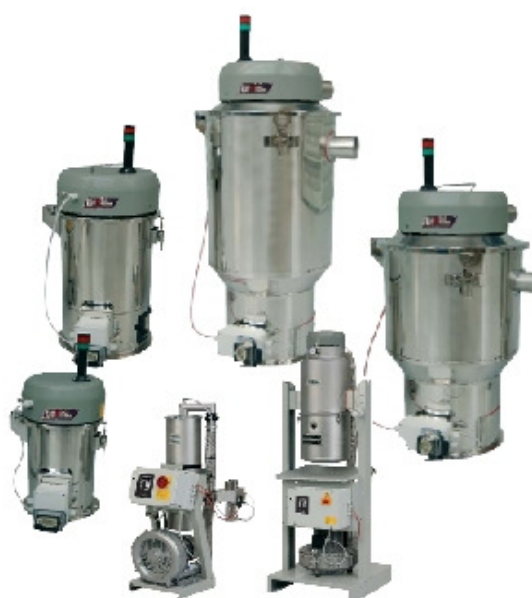
Serie LDM 3-faset vakuumtransportører med kapacitet op til 5000 kg/h.