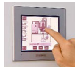
Touch screen styring