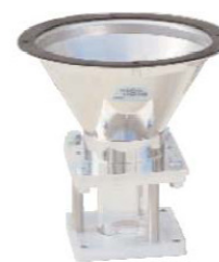
Mange forskellige ma- skintragte