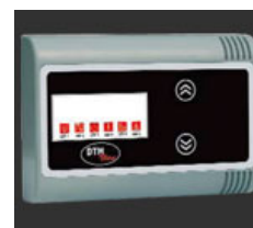
DTM overvågnings display