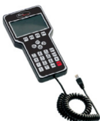
Hånd kontrolpanel (Passer til alle PS produkter)