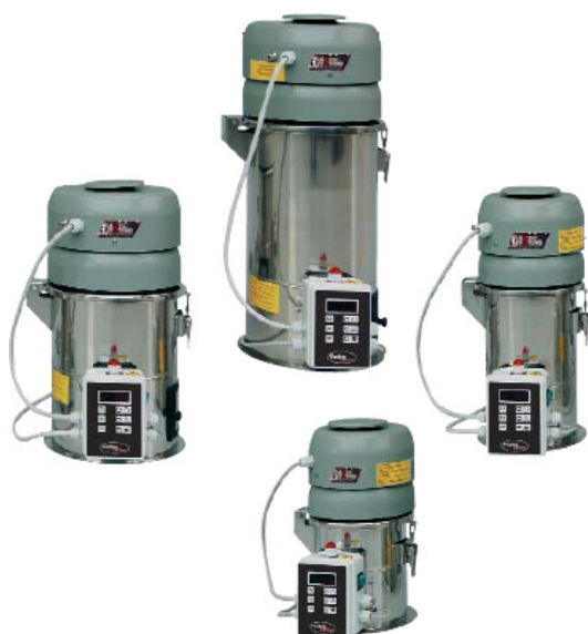
Serie VLM singlefaset vakuumtransportører med kapacitet op til 120 kg/h.

Plastic Systems producerer både single- og 3-faset vakuumtransportører til transport af granulat og regranulat. Alle modeller er med automatisk filterrenblæsning.