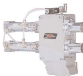
Doseringsventil med og uden styring